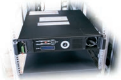
Auf manuellen Bypass umschalten, S1 oder S2.