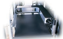
Fehlerhaftes Modul ersetzen.