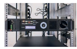
Modul festschrauben, nach dem Anlaufen manuellen Bypass zurücksetzen.

Alle Vorgänge werden in der Betriebsanleitung genau beschrieben.