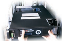
Die Schrauben links und rechts lösen und das Modul herausnehmen.